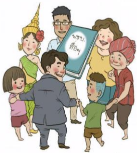
ร่วมสนับสนุน บวร.กองทุนสื่อฯ ที่มีส่วนร่วมของภาคประชาชน

ยกร่าง พรบ.กองทุนสื่อปลอดภัยและสร้างสรรค์ ฉบับประชาชน การขับเคลื่อน 12 ปี 8 รัฐบาล